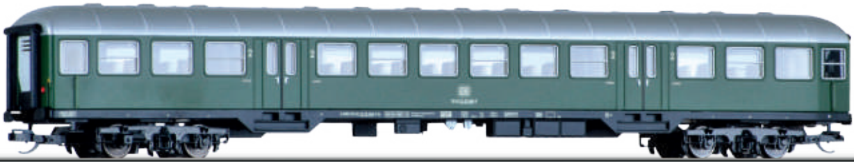
Abbildung zeigt Art. 13867

Art.-Nr. 13850 • 13851 • 13852 • 13853 • 13854 • 13855 • 13867 13856 (Ergänzungswagen zu Set 01422) • 13857 (Ergänzungswagen zu Set 01422) 13858 (Ergänzungswagen zu Set 01555) • 13863 • 13864 • 290461 (für Set 01422) 290462 (für Set 01422) • 290533 (für Set 01555) • 290535 (für Set 01555) 290542 (für Set 01556) • 290942 (für Set 01599) • 291655 (für Set 01724) 291809 (für Set 01443) • 291811 (für Set 01443)