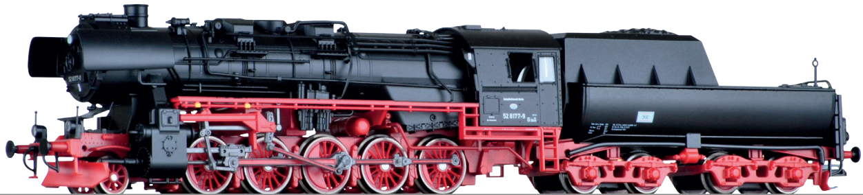
Abbildung zeigt 02289

Art.-Nr. 02274 • 02280 • 02282 • 02286 • 02289