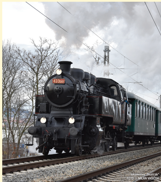
lokomotiva „Skaličák“