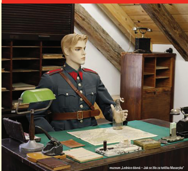
muzeum „Lednice dávná – Jak se žilo za tatíčka Masaryka“